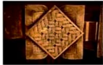
ලේකඩවල කෙළුම් මල් කැටයම්