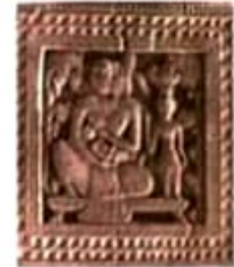
දරුවෙකුට සිටිපොවන මව